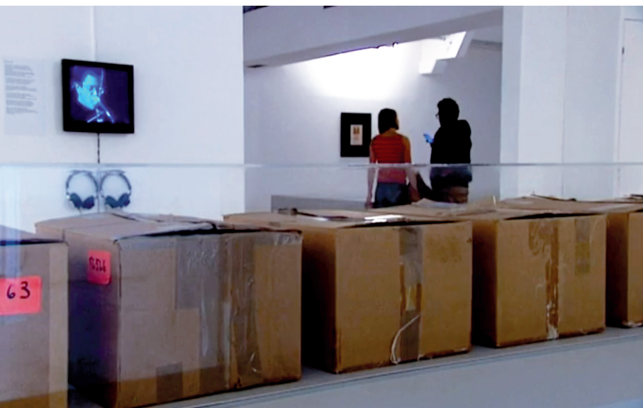
Exposition Andy Warhol : Time Capsules , [MAC], Marseille, 6 décembre 2014 – 12 avril 2015.

I think images are worth repeating and repeating and repeating. (Je pense que les images valent la peine d'être répétées, répétées, répétées.) Lou Reed/John Cale, « Images », Songs for Drella (1990)